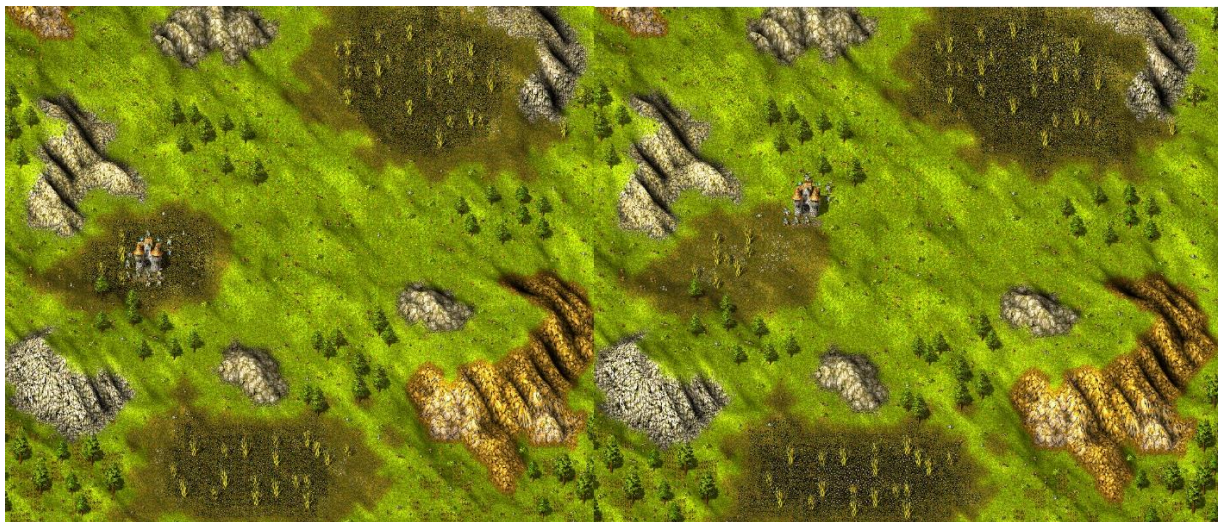
Пример различного расположения угля

Игроки изначально не знают карту, на которой им предстоит играть. Карта генерируется во время загрузки на основе заданных шаблонов. На данной версии карты существует 330 вариантов шаблонов локаций. На каждом из этих шаблонов локаций вам может выпасть разное количество железной руды, золотой руды, угля, рыбы и винных полей. На некоторых из этих шаблонов местоположение конкретного ресурса может меняться, как и количество доступных мест для рудников, водоёмов для вылова рыбы, источников винных полей.